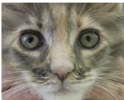
Фото 5. Гнойные двусторонние истечения из носа при герпес-вирусной инфекции кошек