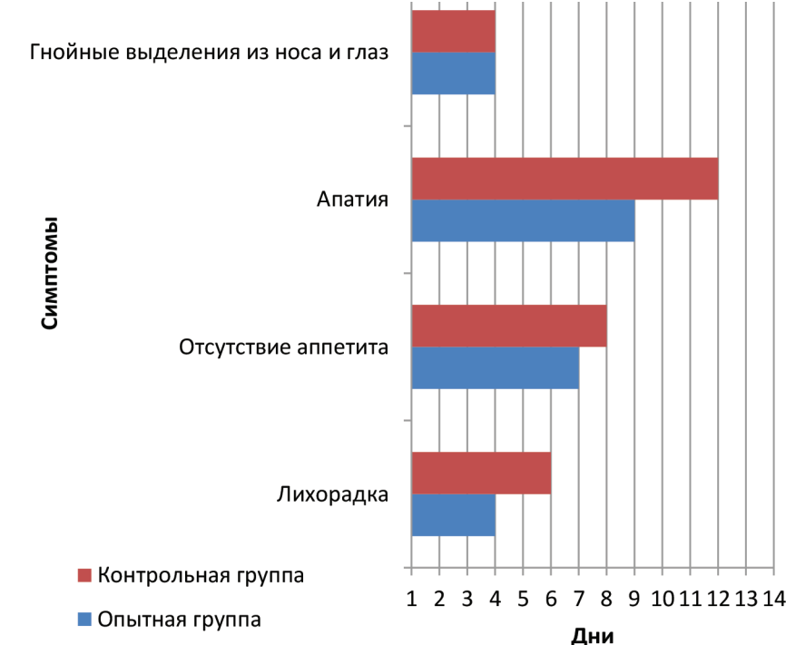
Рис. 2. Оценка критериев эффективности препарата «Фелиферон» в опытной и контрольной группах кошек с вирусными респираторными заболеваниями

Заключение. В ходе проведения клинической апробации рекомбинантного интерферона кошки «Фелиферон» была выявлена его эффективность в комплексной терапии калицивирусной и герпес-вирусной инфекций кошек. В опытной группе животных выздоровление наступало в большинстве случаев раньше, а клиническая картина развивалась менее выражено или не развивалась совсем после начала применения «Фелиферона». Кошки, получавшие видоспецифичный интерферон, быстрее восстанавливали терморегуляцию, возвращались к самостоятельному приему корма (рис. 2).