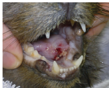
Фото 3. Язвенный процесс с некрозом тканей языка у кота при калицивирусной инфекции

У пациентов с калицивирусной и герпес-вирусной инфекциями были диагностированы лихорадка, преимущественно постоянного или ремиттирующего типа (74,5 % животных), гнойный ринит (44 %), гнойный конъюнктивит билатеральный