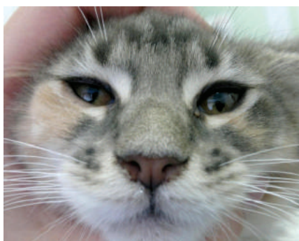
Фото 4. Двусторонний гнойный ринит при калицивирозе у кошки