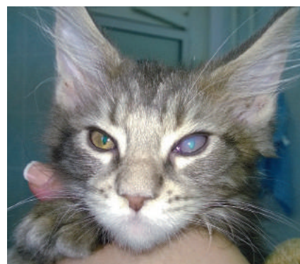
Фото 6. Герпетический кератит у котенка

Восстановление активности у кошек контрольной группы больных герпес-вирусной инфекцией наступало в среднем на 12-й день, в то время как пациенты опытной группы начинали вести более активный образ жизни и проявлять интерес к внешним раздражителям уже на 8–10-й день.